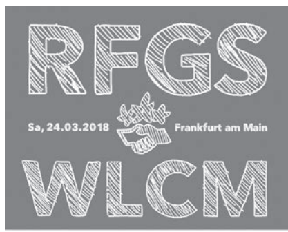
bausteine für die geflüchtetenarbeit

Die Arbeit mit geflüchteten Menschen bleibt auch in 2018 ein wichtiges Thema bei den NaturFreunden und der Naturfreundejugend. Die Bausteine sollen diejenigen unterstützen, die sich in irgendeiner Form in der Arbeit mit Geflüchteten engagieren möchten oder dies bereits tun. Die Bausteine bieten dazu ein inhaltlich und methodisch abwechslungsreiches Programm, das je nach Interesse und Vorwissen belegt werden kann.