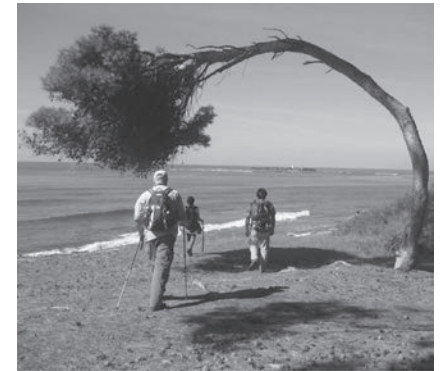
NATURFREUNDE HESSEN PROGRAMM 2018

Aktuelle Programme finden sich immer auf unserer Homepage www.naturfreunde-hessen.de und auf facebook www.facebook.com/NaturFreundeHessen